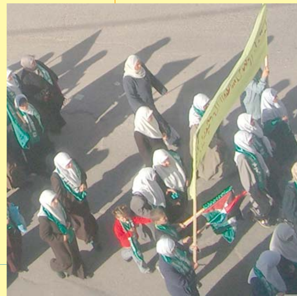
In alto: Ariel Sharon ex Primo Ministro dello Stato di Israele in basso: un corteo di Hamas