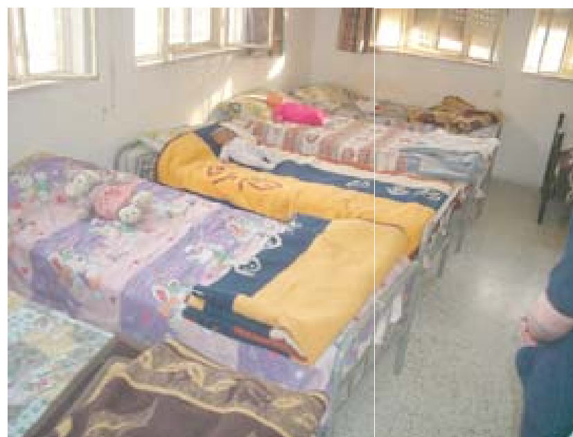
Sopra: Strade di Betania; Una delle camerette della Lazarus Home.