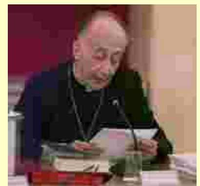
Il Card. Camillo Ruini

vivenza". Qui sta il punto, nel complesso passaggio non solo dell'Italia, ma dell'Europa e del mondo contemporaneo. Lo si può ben affrontare con chiarezza e pacatezza, trovando un sicuro orientamento nella bussola dei grandi principi umani e cristiani che fanno l'identità dell'Italia. Perché l'Italia,