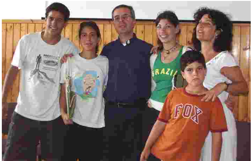
Una settimana di serenità per alcuni ragazzi israeliani vittime indirette del terrorismo ospitati all'Oasi Regina della Famiglia