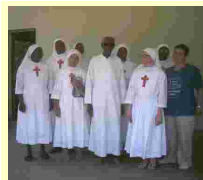
Caterina con le suore Camilliane

Il giorno dopo, ossia la domenica, siamo andati alla festa del parroco. Come vi ho detto, qui è cambiato il parroco per cui hanno organizzato un pranzo di addio e di benvenuto. Credo che qui la Fraternalità si troverà bene: ogni occasione è buona per far festa, con poco, ma sempre con semplicità. C'erano soprattutto preti e suore, ma anche qualche catechista e una dozzina di seminaristi. Poi è venuto anche l'evêque (il vescovo) che, dopo aver mangiato il riso, suonando con il cucchiaino sul bicchiere, richiamava l'attenzione: "J' approfite de l'occasion pour" ... e ha fatto così per almeno 4 o 5 volte. Mi ha anche presentata a tutti gli altri, in questo stesso modo: "J' approfite de l'occasion pour" ... La festa è stata molto semplice: al centro due tavole con il cibo, riso con la carne, pollo, patate fritte, misto di verdure. A self service, anche se i seminaristi si sono attivati per la distribuzione dei piatti e dei bicchieri. Poi gli stessi seminaristi sono passati con le casse delle bibite. Ognuno poi si serviva come preferiva. Poi si sedeva alle sedie poste tutt'intorno alla sala, reggendo il piatto con una mano e mangiando con l'altra (naturalmente munita di cucchiaino). La maggior parte di loro hanno posato il bicchiere