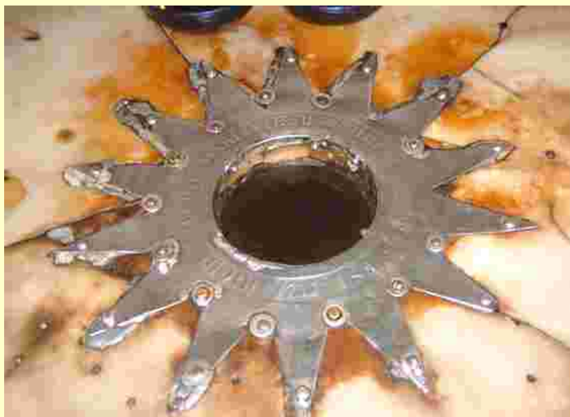
Il punto dove si fa memoria della nascita di Gesù

Ecco la magia della Terra Santa: la capacità di tirar fuori ricordi sepolti