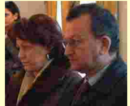
I coniugi Coppola da ottobre sono i nuovi custodi dell'Oasi Betlemme

casa di Episcopio ha rappresentato un importante punto di riferimento per tutta la Fraternità. Un gradito ritorno in una zona, quella di Sarno, e in una casa la cui struttura attuale premette di ospitare anche coppie di sposi che intendono scoprire questa realtà nel modo più diretto possibile. Quest'opportunità è rivolta non solo agli sposi ma anche ai giovani desiderosi di vivere momenti di preghiera e di condivisione.