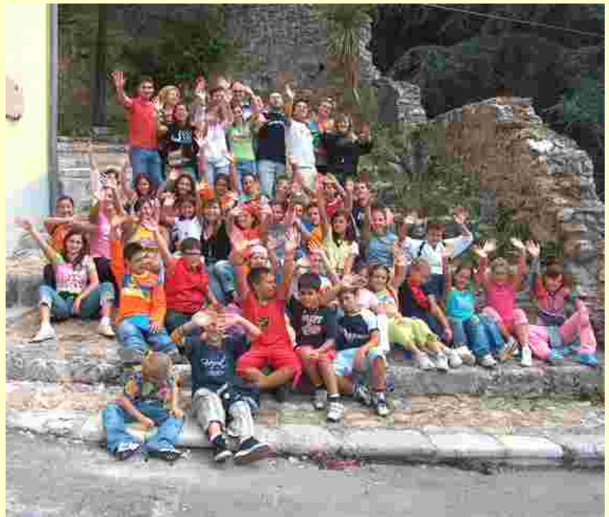
Il gruppo di ragazzi dell'ACR di Poggiomarino

Numerosi sono stati gli eventi e i cenacoli che dal mese di luglio a fine agosto hanno animato la casa di spiritualità della Fraternità. La casa ha così ospitato dal 3 al 5 giugno un gruppo ACR di una parrocchia di Poggiomarino, dall'8 a 10 luglio il Cenacolo sposi della Fraternità che nello stesso mese ha organizzato la scuola di preghiera per giovani e adolescenti. A fine luglio c'è stato un ritiro di un gruppo di sposi della parrocchia di Filetta (SA). Sempre da questa parrocchia sono giunti i giovani che dal 1 al 5 agosto si sono dati appuntamento all'Oasi di Montoro. Il mese di agosto è stato pieno di attività: un gruppo di giovani da Castellammare, altri da Gragnano ed infine i simpatici amici adolescenti dell'ACR di Poggiomarino che con la loro energia hanno saputo creare atmosfere festose rispettando sempre i momenti di preghiera che caratterizzano ogni ritiro.