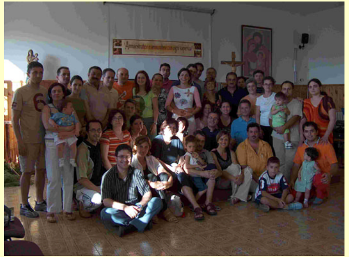
I partecipanti al Cenacolo sposi tenutosi nel mese di luglio all'Oasi Regina della Famiglia

L'incredibile e precoce maturità spirituale di Santa Teresina ha acceso in me, una fiamma che si mantiene ancora viva. Mi sono sentita quasi un nulla nello scoprire che Lei, già alla Prima Comunione, era cosciente che Dio stesse cominciando a far parte della sua vita anzi, come scrive in uno dei suoi Manoscritti: "Lei faceva parte di Dio e scompariva